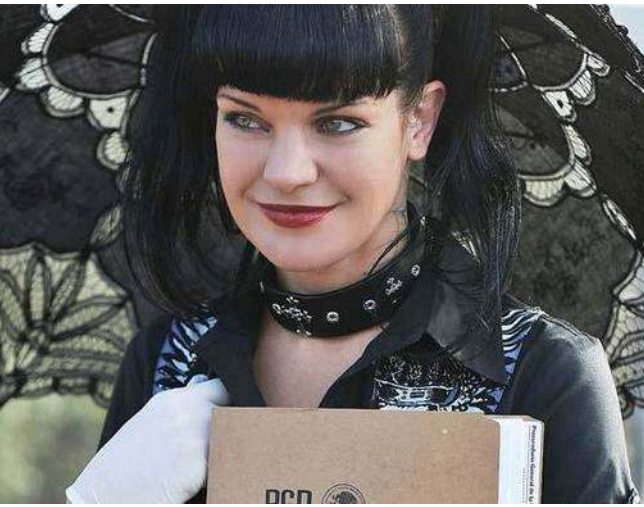
Actrice Pauley Perrette, héroïne de la série US, NCIS , a pour rôle : Abigail Sciuto