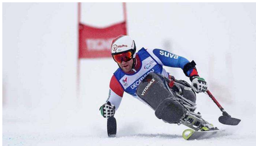
Compétition de handi mono ski

4300 athlètes ayant un handicap sont à Rio de Janeiro, au Brésil, pour les jeux Paralympiques. Les Jeux Paralympiques ont commencé en 1960. Ils se déroulent toujours après les jeux Olympiques et dans la même ville.