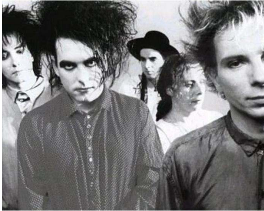
Groupe britannique The Cure , et son chanteur Robert Smith's. Groupe formé en 1976, très connu dans les années 80.

Le mouvement gothique est un courant de contre-culture apparu entre la fin des années 1970 et au début des années 1980 au Royaume-Uni, après les mouvements musicaux punk et post-punk. Il s'est en partie inspiré du cinéma expressionniste allemand, du fantastique et du roman gothique. Le mouvement et son esthétique se sont propagés sous des formes diverses en Europe et aux États-Unis.