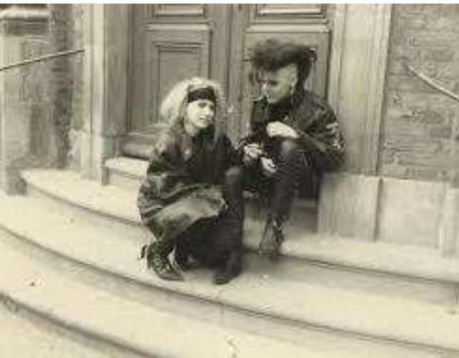
couple punk anglais dans les années 70, à Londres.