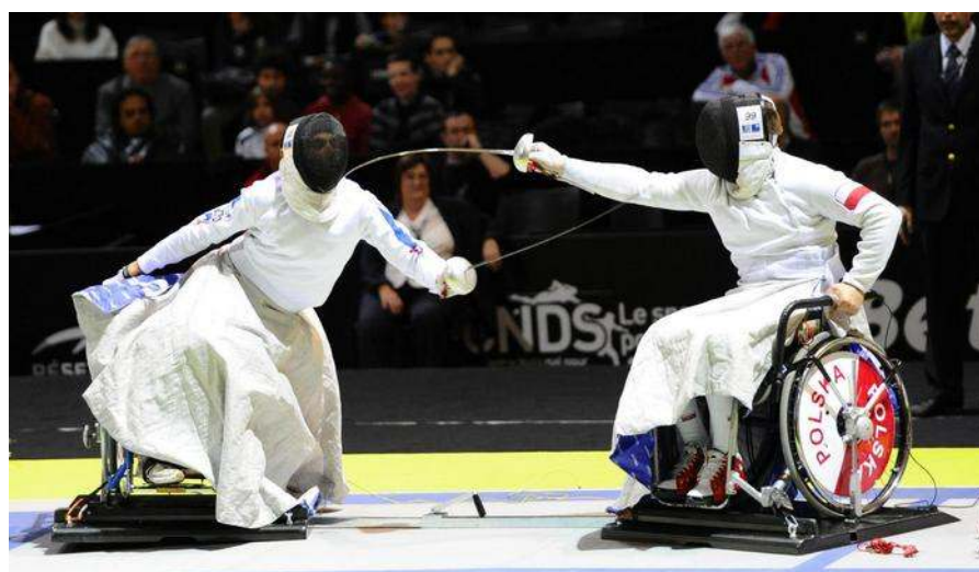
escrime en handisport

Ils durent 11 jours. Il existe 4 groupes d'athlètes : Les malvoyants, les handicapés physiques, les handicapés mentaux, les athlètes amputés (sans jambe...).